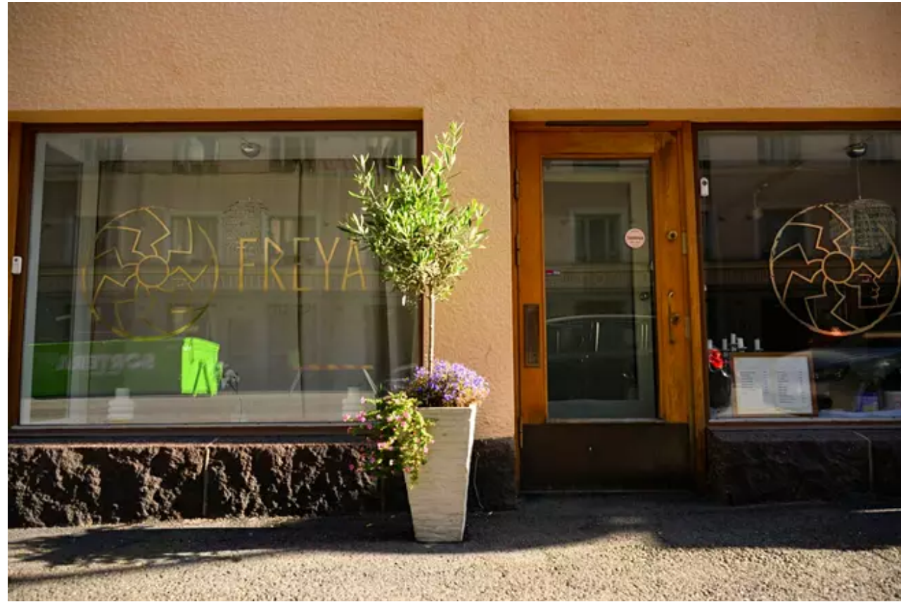
Venäjän Helsingin-suurlähetystön läheisyydessä sijaitseva kampaamo oli suljettu tuntia aiemmin kuin tavallisesti.