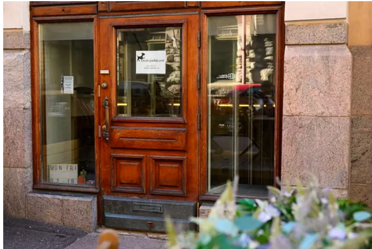
Koiraparkilla on koirapäiväkoteja Kampin lisäksi Herttoniemessä ja Espoossa. KUVA: JUSSI HELTTUNEN

Avaamme kuvaajan kanssa Kampissa sijaitsevan Koiraparkin oven noin puolen kuuden tienoilla illalla. Sisällä on yksi asiakas lemmikkeineen, joka hänkin suuntaa lämpimään loppukesän iltaan lähestulkoon heti meidän astuttuamme sisään.