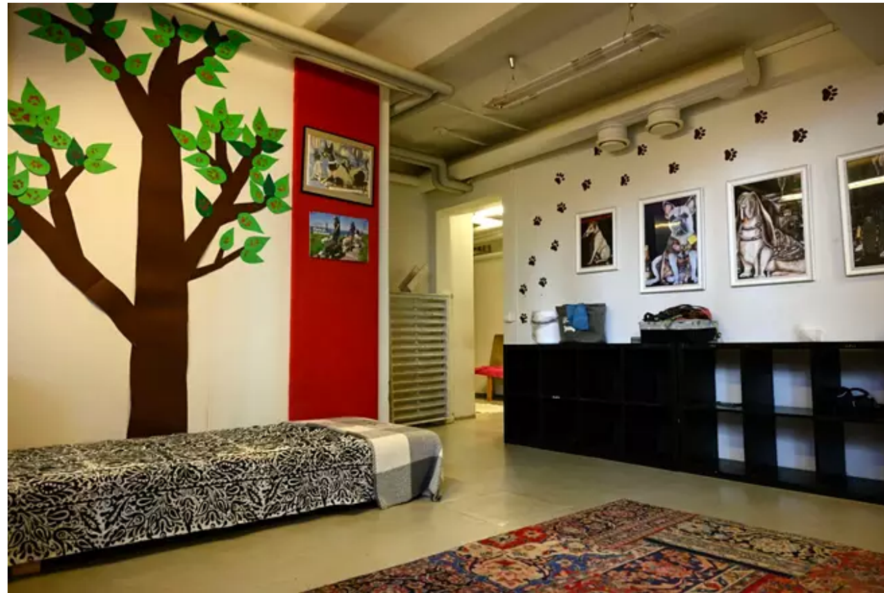
Kampin Koiraparkissa oli hiljaista tiistaina ennen sulkemisaikaa.

” Meillä vaalitaan asiakkaan yksityisyyttä, emmekä puhu koskaan asiakkaistamme toisille asiakkaille. Toimimme hyvin anonyymisti.